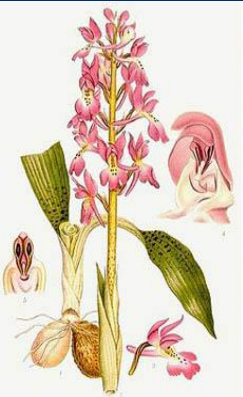
SANKT PERS NYCKLAR, ORCHIS MASCULUS L.