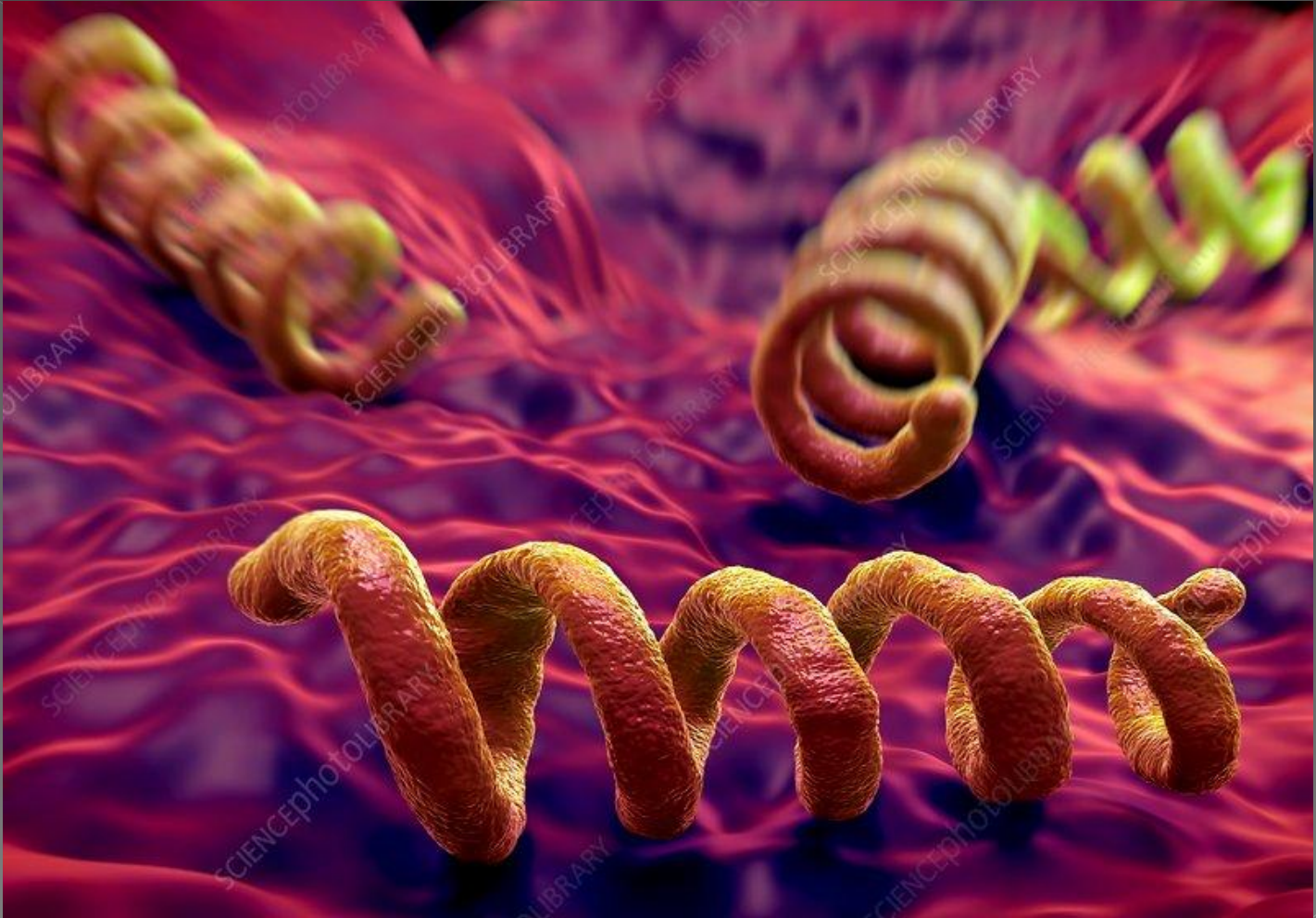
Предизвикувач на сифилис – TREPONEMA PALIDUM