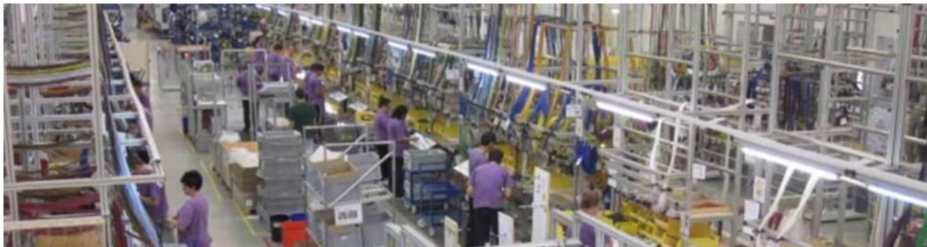
Табела: Расположлива инфраструктура во Индустриска зона Жабени